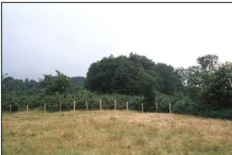
Obr.3. Typová lokalita druhů Athous nadoraz a Athous tekkirazicus v okolí obce Tekkiraz