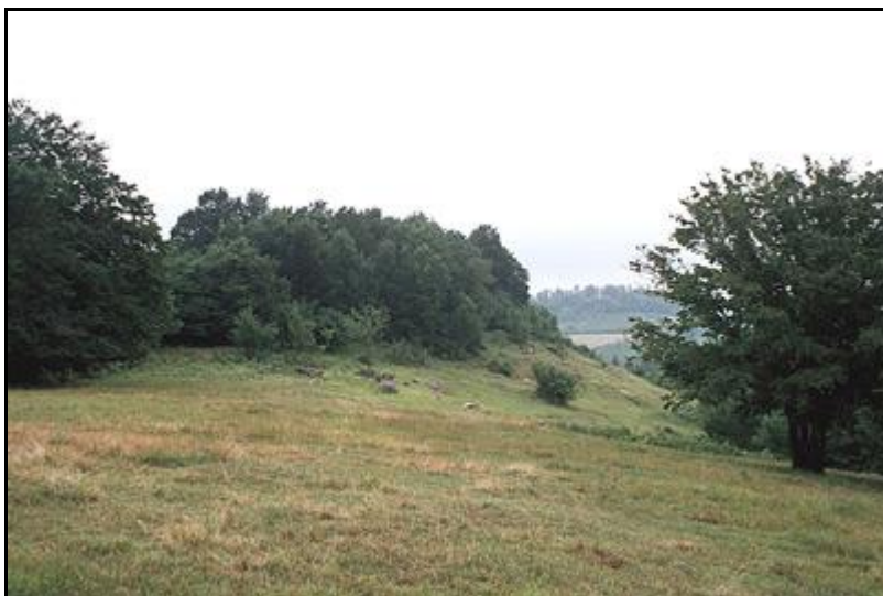
Obr.4. Lokalita druhu Athous nadoraz v okolí obce Tekkiraz