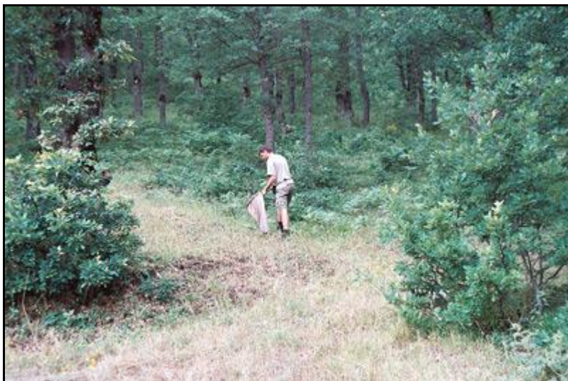
Obr. 2. Smyk Athous nadoraz v okolí městečka Akkuş v červnu r. 2006