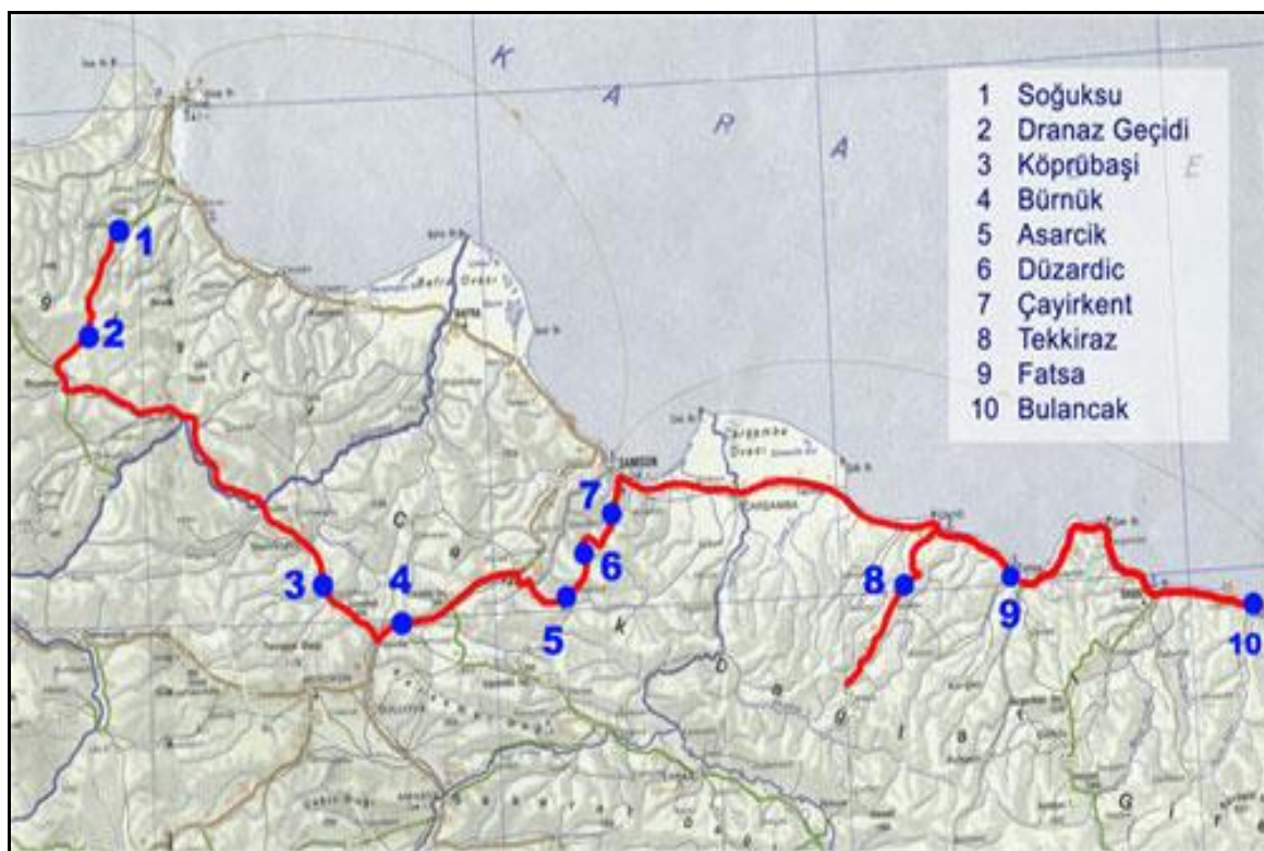
Obr.1. Trasa akce 29.6.2002 s vyznačením jednotlivých lokalit