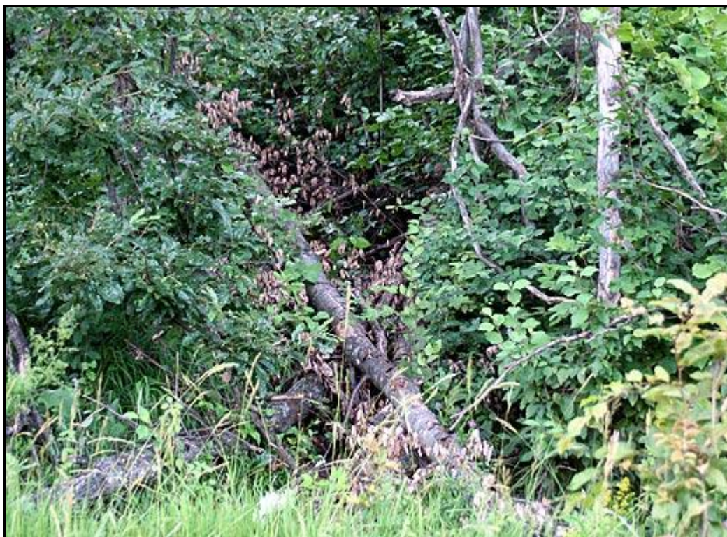
Muránska planina, Šiance, detail biotopu Hylis simonae (Olexa, 1970)