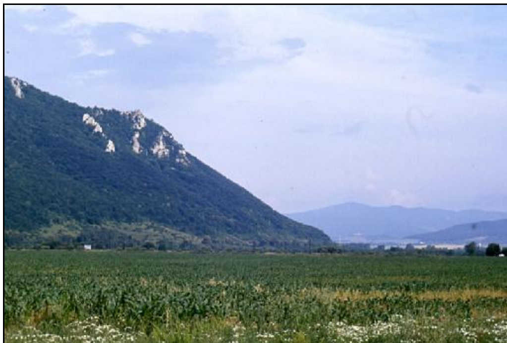
Plešivecká planina, Brzotín env., biotop Hylis simonae (Olexa, 1970)