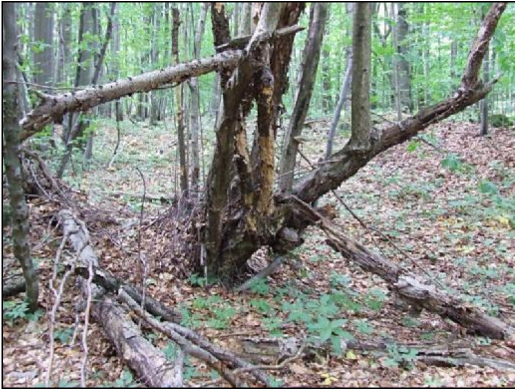
Vihorlat, Remetské Hámre, detail biotopu Hylis olexai (Palm, 1955)