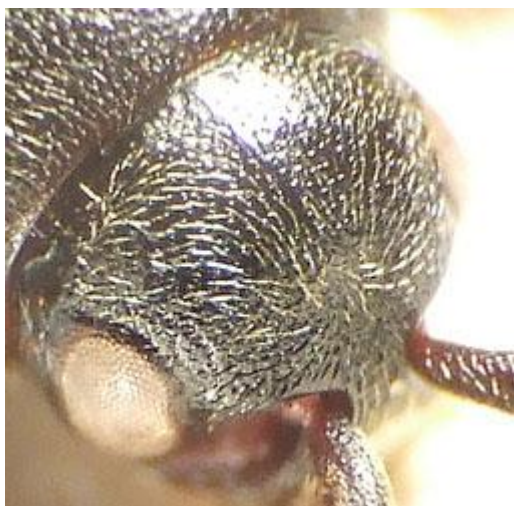
Hylis foveicollis (Thomson, 1874)