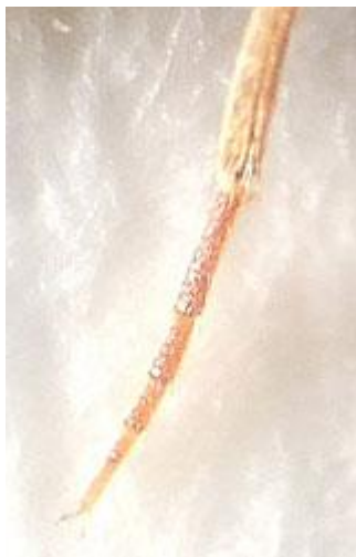
Hylis olexai (Palm, 1955)