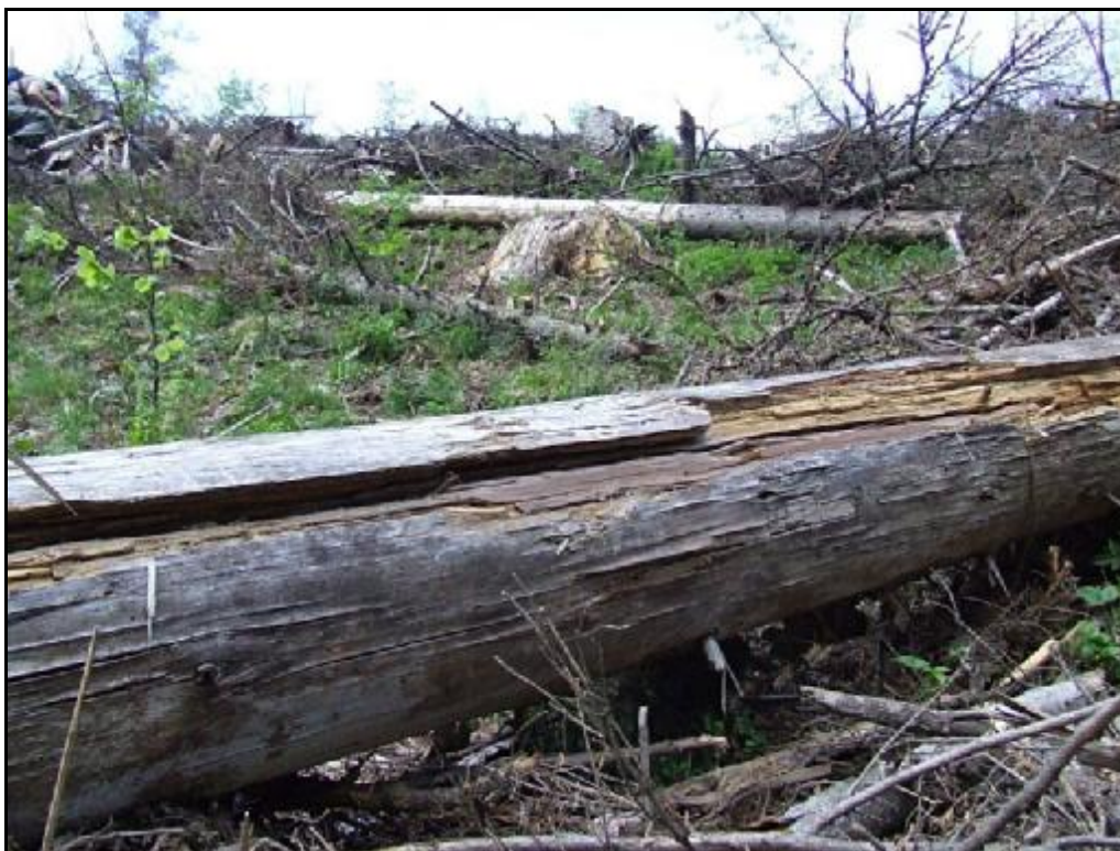
Nízké Tatry, Staré Hory, detail biotopu Hylis foveicollis (Thomson, 1874)