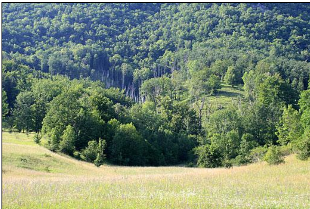
Muránska planina, Šiance, biotop Hylis simonae (Olexa, 1970)