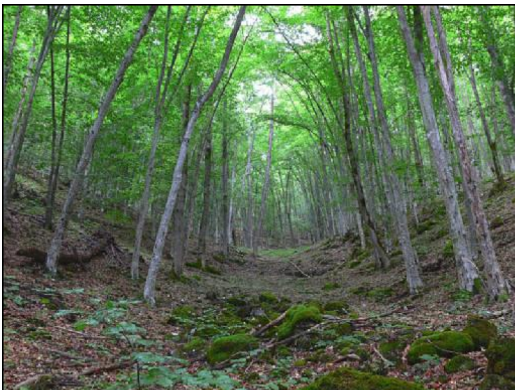
Muránska planina, Poludnica, biotop Hylis cariniceps (Reitter, 1902)